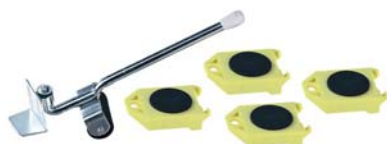
viermaal met lifter