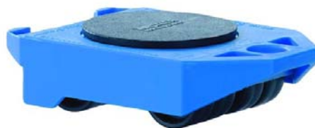
met draaikruis en kantelbeveiliging