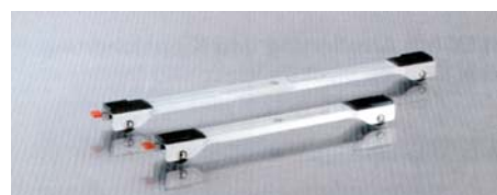
met vastzetrem, uittrekbaar